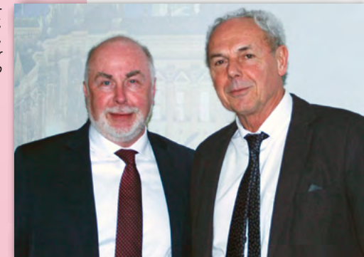
Egon Höfling, Bundesvorsitzender FWSV, mit Ulrich Silberbach, Bundesvorsitzender des dbb